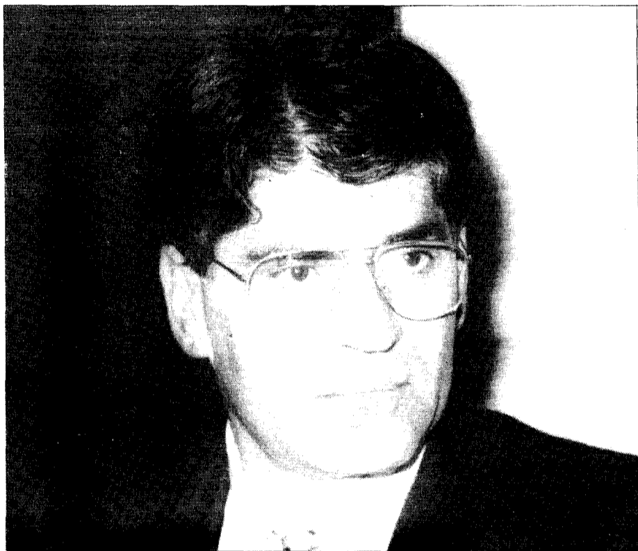
El consejero de Industria califica de «falsa y tendenciosa» la nota de los ingenieros