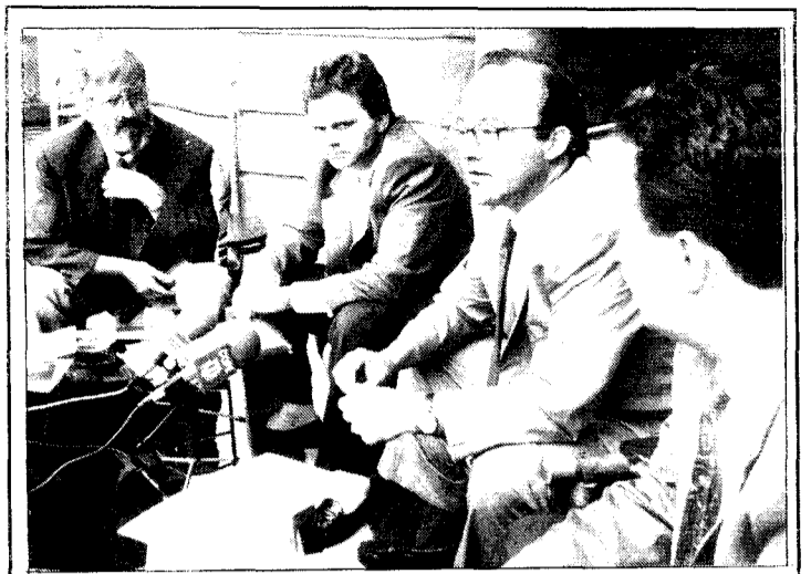
CONGRESO DE METODOS NUMERICOS EN INGENIERIA. Los miembros del Comité Organizador del Congreso de Métodos Numéricos en Ingeniería, que se inauguró en nuestra capital el pasado lunes, celebraron al mediodía de ayer una rueda de prensa en el Hotel Santa Catalina para comentar los pormenores del mencionado congreso. Ayer por la tarde, a las siete y media, se ofreció un cóctel por parte de las autoridades municipales a los congresistas

Además y según confirmaron dichas fuentes, están pendientes otra serie de subvenciones previstas por el Ministerio para Canarias en concepto de transporte colectivo, tanto urbano como interurbano, que no se han recibido todavía, y que en teoría iban a servir para la mejora tanto de infraestructura como de calidad y seguridad de la red insular.